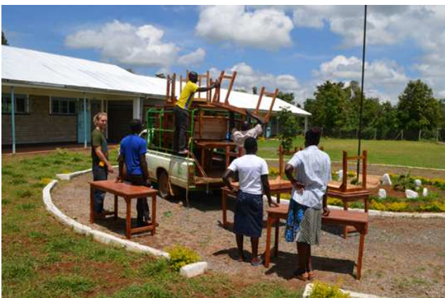
Möbellieferung und Schulbücher-Ausstattung.

Ein Schwerpunkt der FORWAC-Aktivitäten im Jahr 2015 lag neben der Eröffnung der Schule auf ihrer Ausrüstung mit Möbeln, Küchenutensilien und Lehrmaterialien, ebenso wie auf der Finalisierung einzelner Baumaßnahmen und Durchführung einzelner Reparaturen. So wurden zum Beispiel die undichten Stellen der Regenrinnen behoben, lockere Waschbecken fixiert und das Schattendach für die Pausen wieder aufgebaut nachdem es durch einen starken Sturm zerstört worden war.