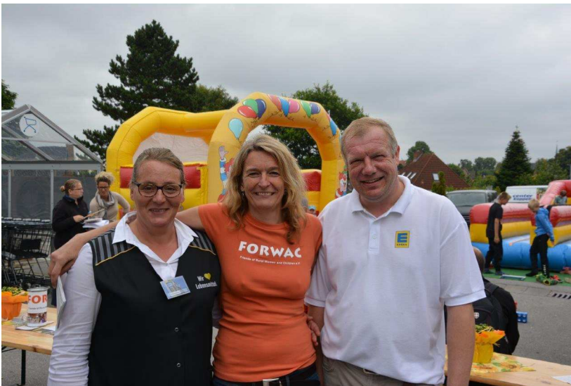
FORWAC beim Kinderfest Edeka Kappeln in 2015.

Im Jahr 2015 konnte FORWAC eine Aufstockung des laufenden Projektes durch die Stiftung „Ein Herz für Kinder“ akquirieren. Zum dritten Mal durfte FORWAC auf dem Kinderfest des Edeka Center Kappeln vertreten sein und erhielt den Erlös der Tombola als Spende.