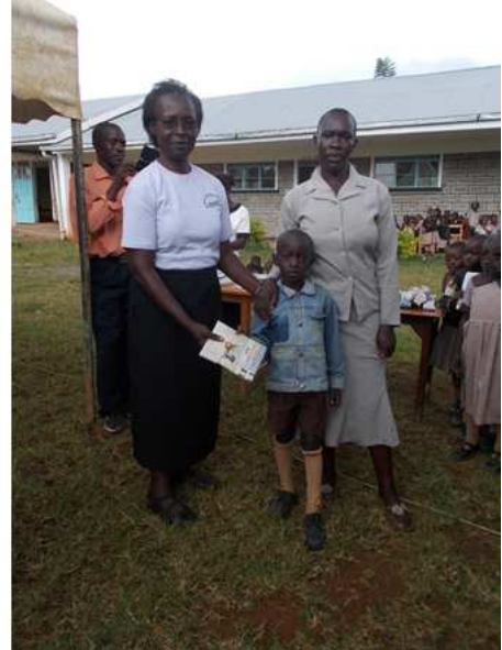
Feier Schuljahres-Abschluss 2015.