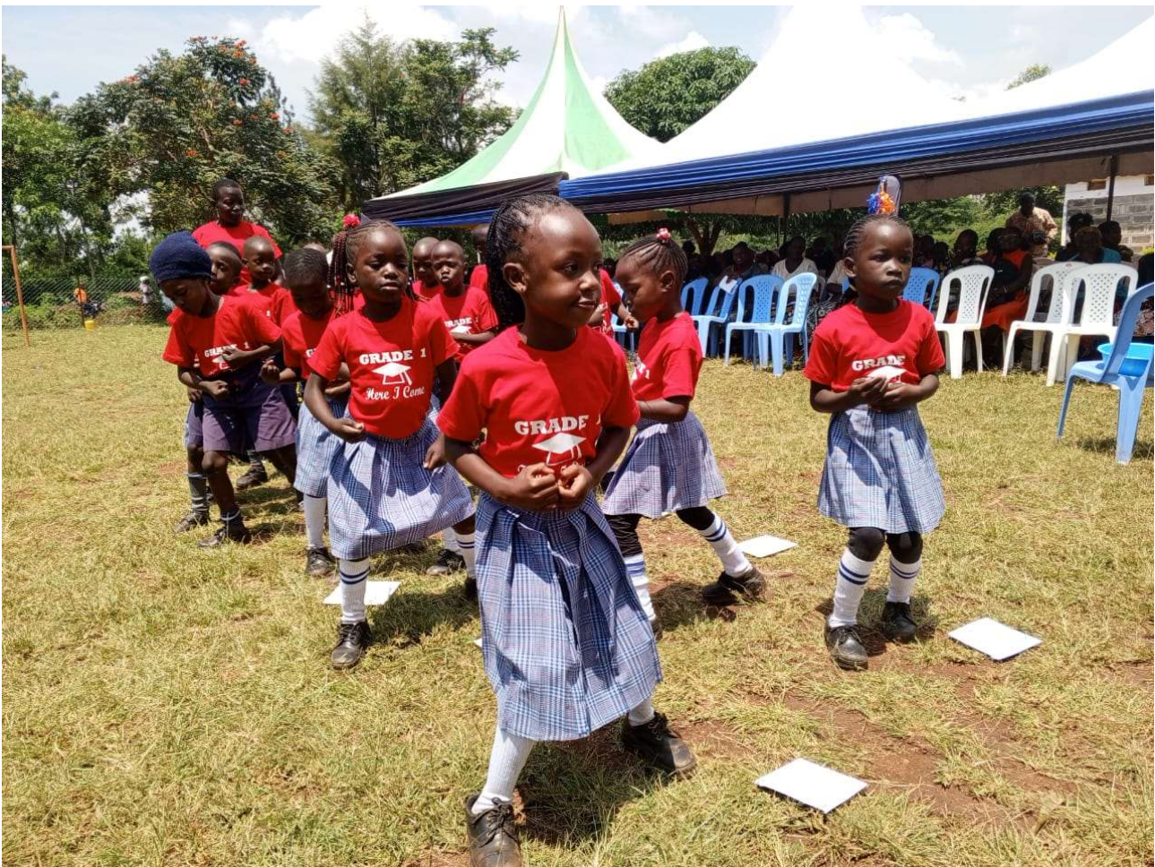
FORWAC-Grundschüler:innen. Tanz beim Schuljahresabschluss.