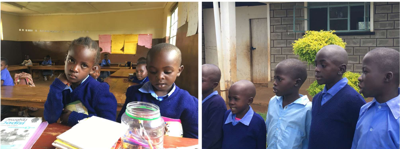
Abbildung 2: Gebäudekomplex der FORWAC Vor- und Grundschule (oben), FORWAC-Schüler:innen (unten).