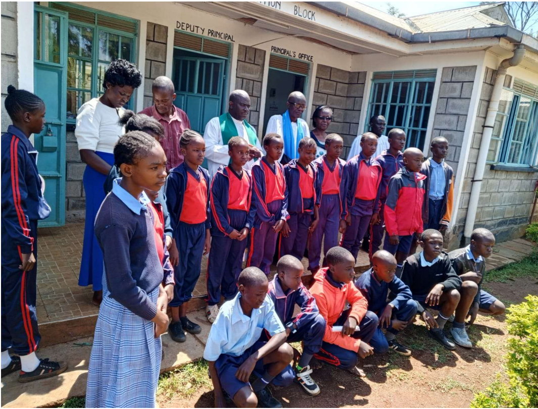
Abbildung 8: FORWAC Schüler:innen vor einem Sportwettbewerb.