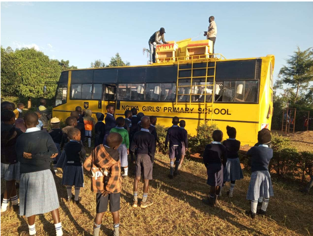
Abbildung 9: Schulausflug der FORWAC Schüler:innen nach Kisumu.