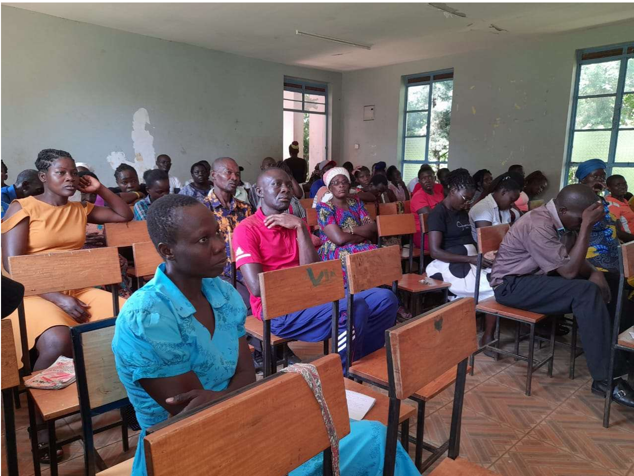
Abbildung 4: Teilnehmende Eltern bei einer Elternversammlung 2024.

Regelmässig gab es auch in 2024 Elternversammlungen, um sich über Bedürfnisse und Herausforderungen auszutauschen. Einige der Eltern der FORWAC-Schüler:innen nutzen aktuell das kleine FORWAC-Grundstück etwas entfernt der Schule für den Anbau von der Korn und Gemüse.