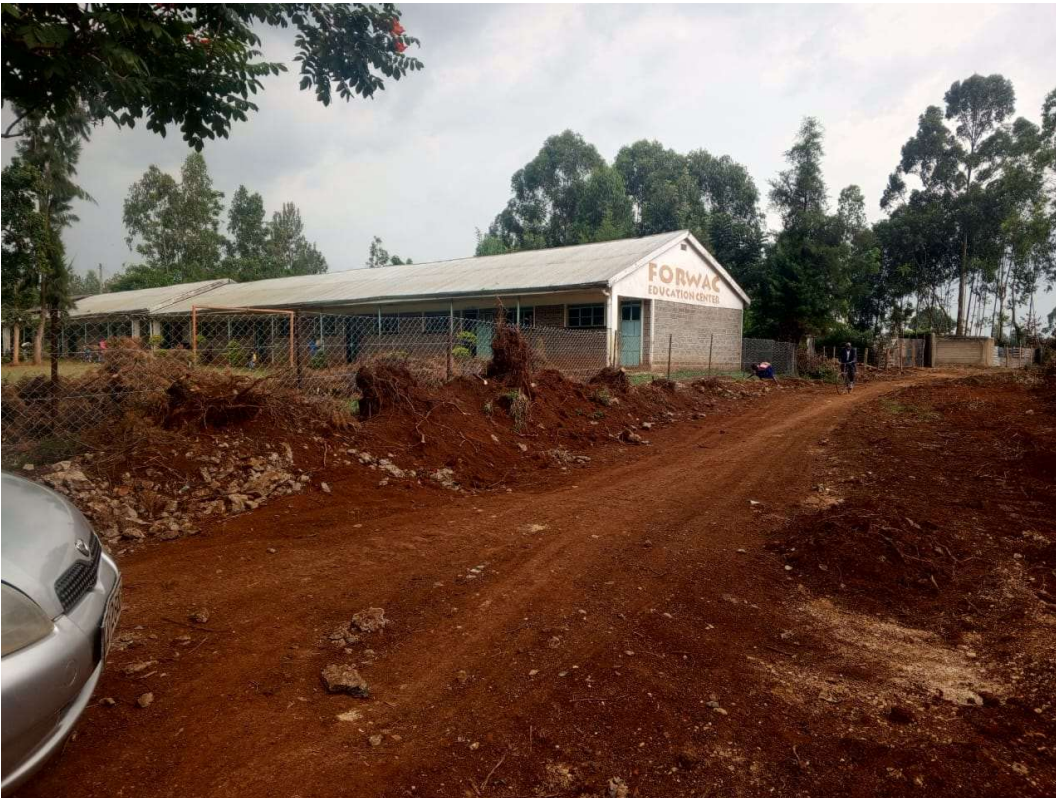
Abbildung 11: Verbreiterung des Weges, der um den FORWAC-Gebäudekomplex geht.