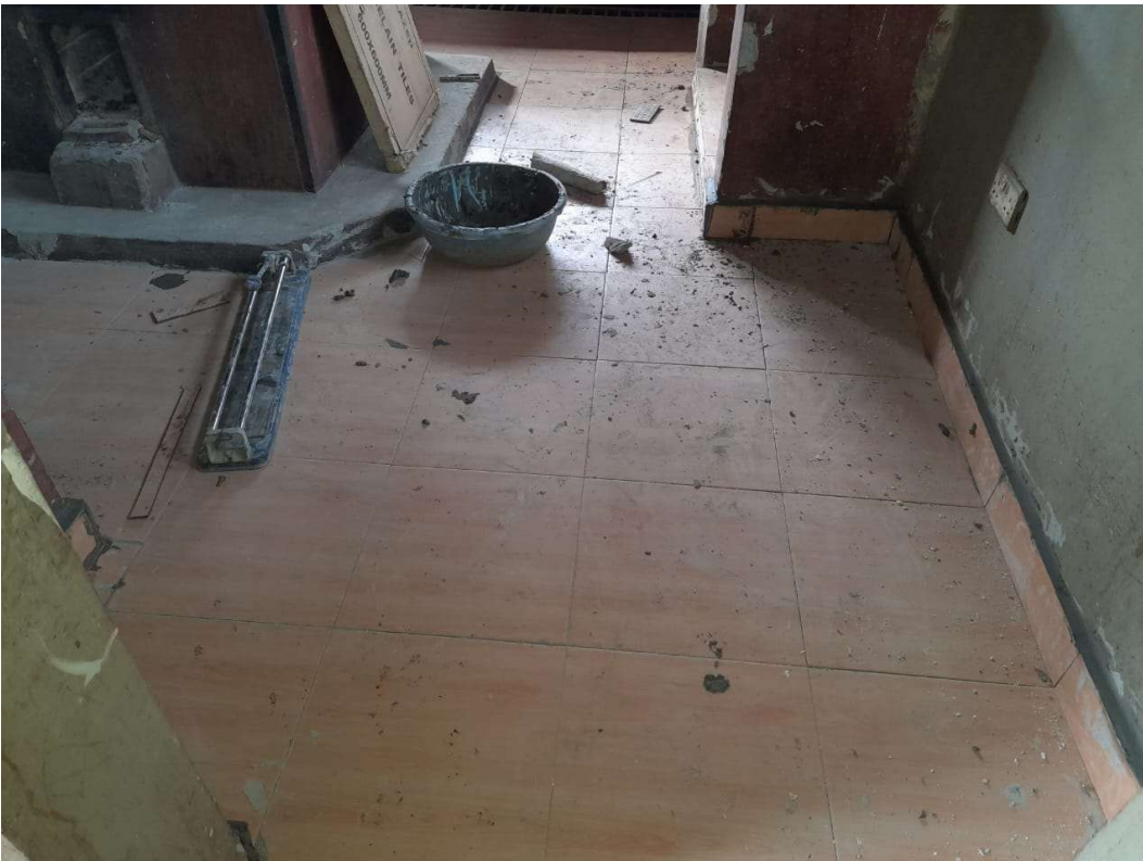
Abbildung 12: Fliesenarbeiten im Gebäudekomplex.