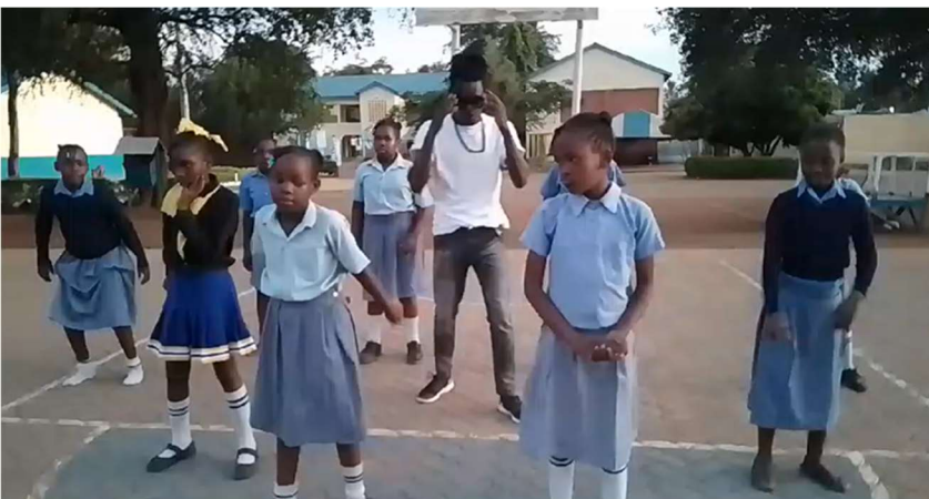
Abbildung 7: FORWAC Schüler:innen beim Tanzwettbewerb.

Wie in den vergangenen Jahren waren die FORWAC-Schüler:innen in lokalen, regionalen und nationalen Aktivitäten beteiligt und holten beim Tanz- und Theater-Wettbewerb zwei Pokale nach Hause. Auch der Schulausflug mit allen Kindern der FORWAC Vor- und Grundschule nach Kisumu wurde 2024 umgesetzt. Des Weiteren gab es einen Projekttag zur Sexual-Aufklärung der FORWAC-Schülerinnen.