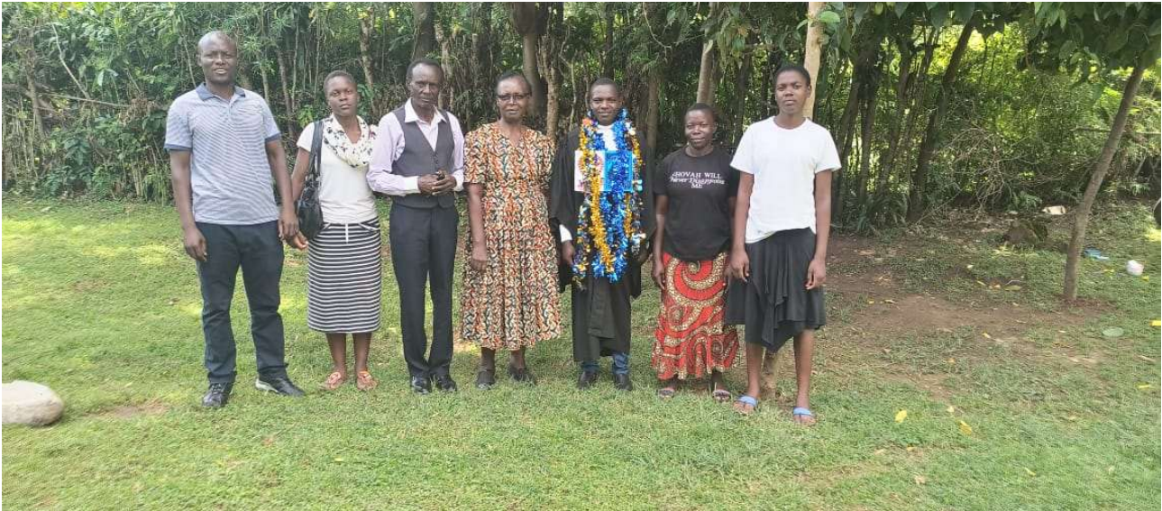
Abbildung 13: FORWAC-Jugendlicher in Bildungspatenschaften.

Im Verlauf des Jahres 2025 konnten wir 15 Kinder und Jugendliche mit Bildungspatenschaften unterstützen. Davon sind 2 Kinder in der Grundschule, 10 Jugendliche in der Oberschule und 3 Jugendliche im College.