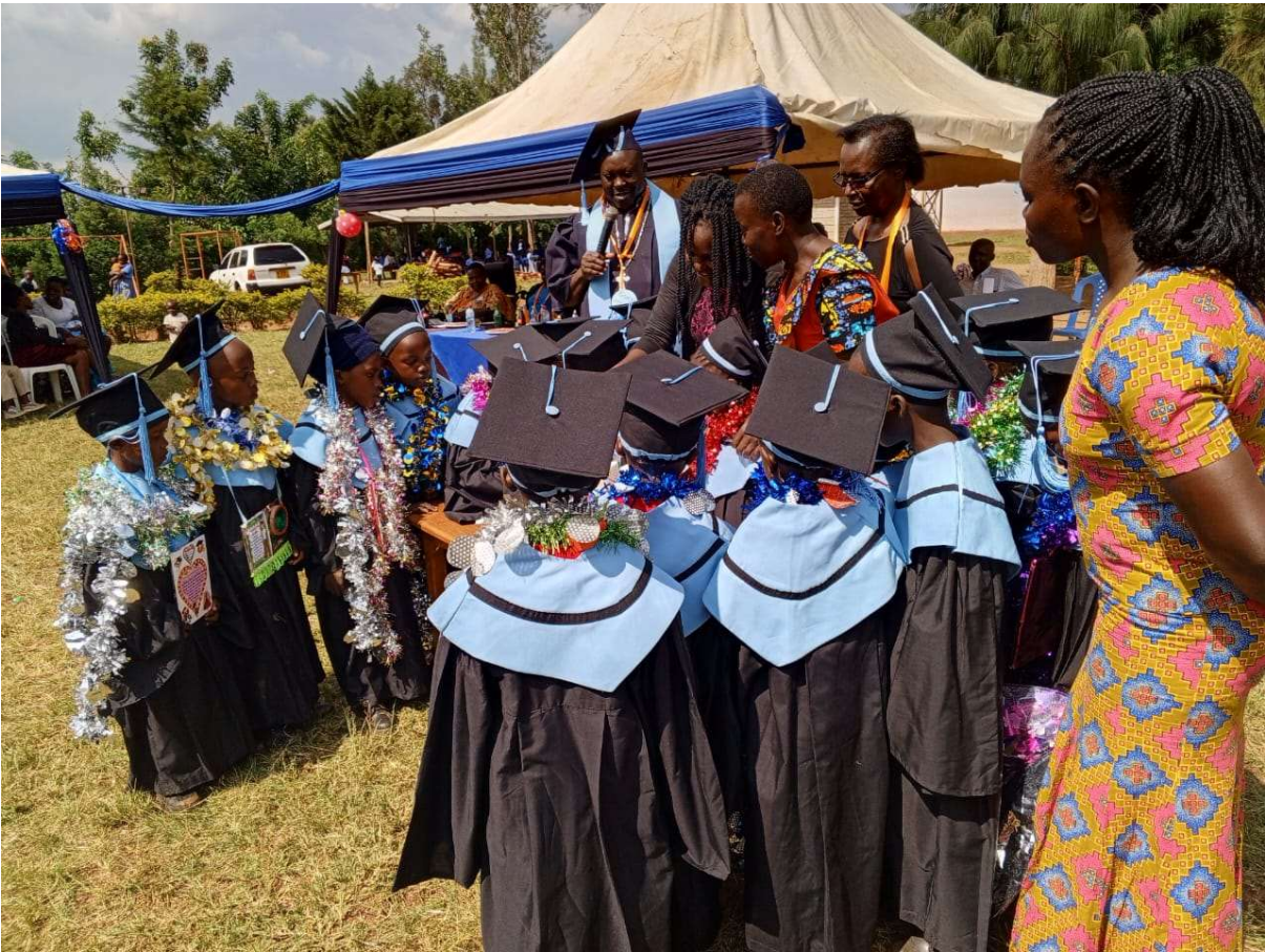
Abbildung 6: Zeremonie zum Abschluss des Schuljahres.

Wie in den vergangenen Jahren waren die FORWAC-Schüler:innen in lokalen, regionalen und nationalen Aktivitäten beteiligt und holten beim Tanz- und Theater-Wettbewerb zwei Pokale nach Hause. Auch der Schulausflug mit allen Kindern der FORWAC Vor- und Grundschule nach Kisumu wurde 2024 umgesetzt. Des Weiteren gab es einen Projekttag zur Sexual-Aufklärung der FORWAC-Schülerinnen.