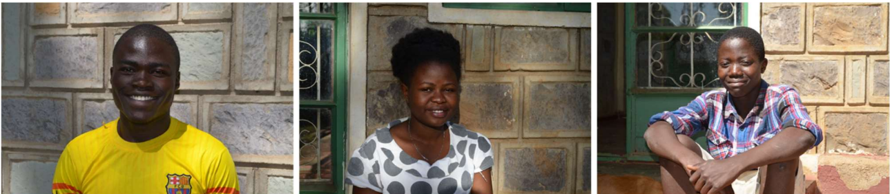
Abbildung 3: Jugendliche der FORWAC-Bildungspatenschaften.

Ziel ist es, die Kinder bis zum Ende der Schul- und Berufsausbildung zu unterstützen, bis sie zu verantwortungsvollen und eigenständigen jungen Erwachsenen herangewachsen sind. Unser Engagement endet nicht von "heute auf morgen" mit dem Abschluss der Oberschule, denn nur durch eine vollständige Ausbildung haben die Kinder die Chance selbstständige Persönlichkeiten zu werden und dadurch langfristig die Gemeinde Ulamba zu stärken. So engagieren wir uns weiter und unterstützen die Kinder in ihrer weiteren Ausbildung, wie zum Beispiel bei einem College oder Universitätsbesuch.