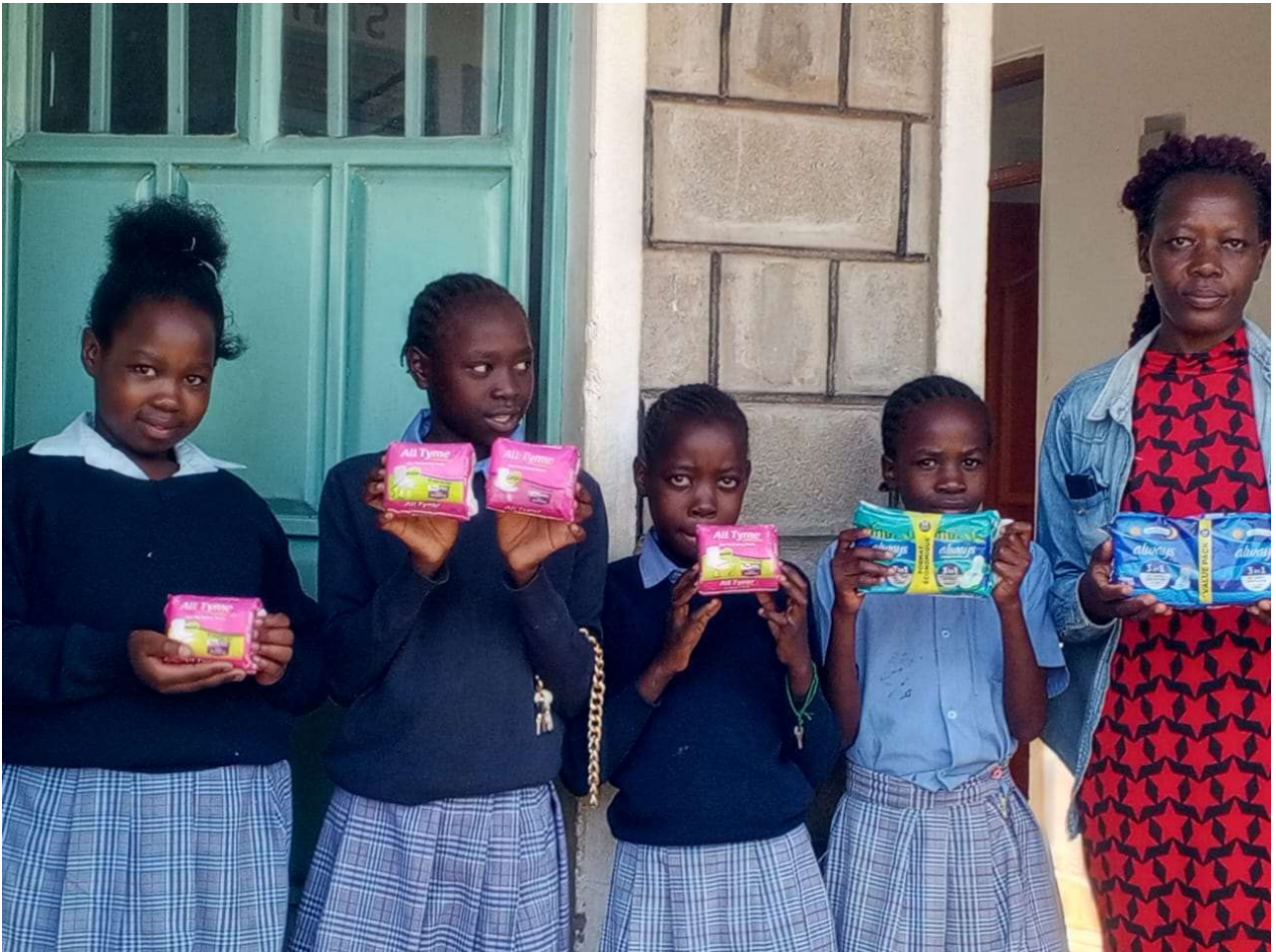
Abbildung 10: Aufklärungsarbeit für FORWAC Schülerinnen nach Kisumu.

Pflege und Reparaturarbeiten am Schulkomplex gehören zu dem operativen Betrieb der FORWAC Vor- und Grundschule dazu. Im 2024 waren Fliesen- und Malerarbeiten in Teilen der Gebäude notwendig, die Solaranlage hatte einen Unterbruch und durch eine Verbreiterung des Weges rund um die FORWAC-Schule entstanden notwendige Arbeiten an den Grundstückzäunen.